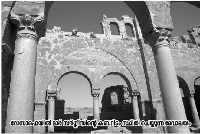
റോസാഫെയിൽ മാർ സർഗ്ഗീസിന്റെ കബറിടം സ്ഥിതി ചെയ്യുന്ന ദേവാലയം